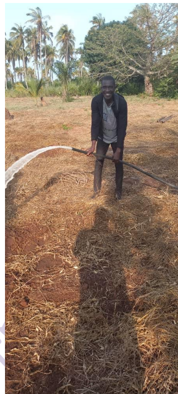
Monsieur Folly KOUMOUGANH qui arrose pour la première fois les Ylang-Ylang !